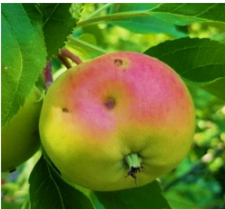
Wanzen Schaden an Apfel

In den vergangenen Rundschreiben haben wir bereits über verschiedene Wanzenarten berichtet. Heuer war, besonders zum Spätsommer hin, ein vermehrtes Auftreten von Wanzen zu beobachten. Invasive Wanzenarten wie die Grüne Reiswanze oder die Marmorierte Baumwanze sind neben den Obstgehölzen auch im Hausgarten an Gemüse und Zierpflanzen bzw. Ziergehölzen vermehrt anzutreffen.